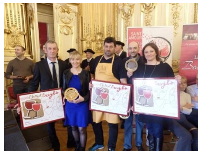
La Meunière, L'Harmonie des Vins et Chez Mounier

Inter Beaujolais a comme partenaire Only Lyon , ce qui permet au précieux nectar d'être présent lors d'un grand nombre de manifestations, en France et à l'étranger, car il faut reconnaître que Lyon a besoin du Beaujolais dont le vin est souvent plus connu dans le monde que la capitale des Gaules.