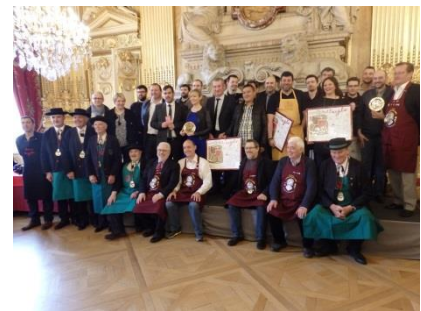
Dix trophées ont été décernés