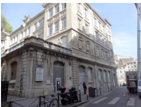
Groupe scolaire Michel Servet, rue Alsace Lorraine